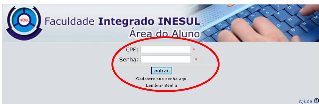
IMAGEM 02 – LOGIN E SENHA