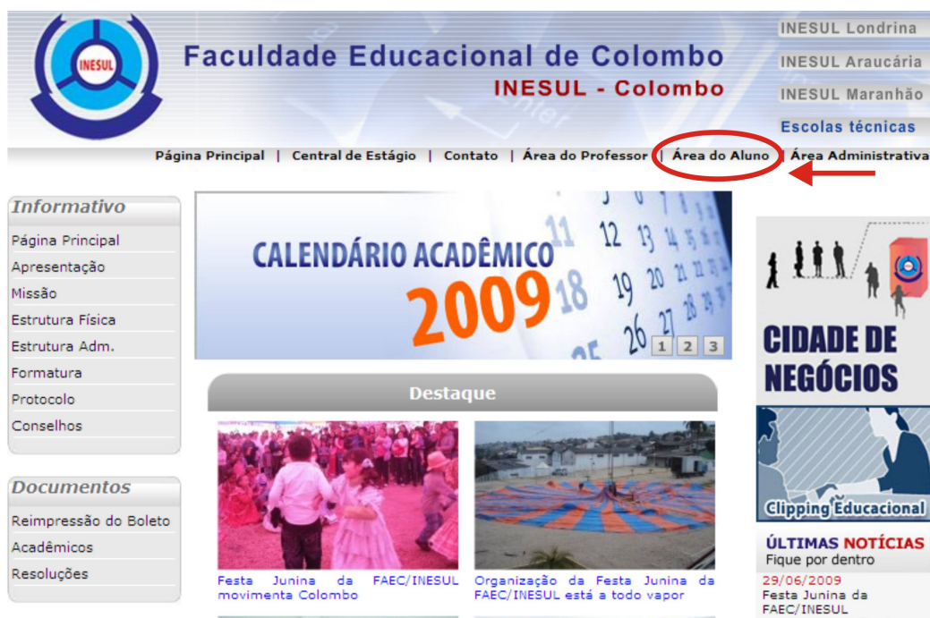
IMAGEM 01 – ÁREA DO ALUNO

1º PASSO - O ALUNO DEVERÁ ACESSAR SUA ÁREA COM O LOGIN E SENHA, CONFORME IMAGEM 01 E 02.