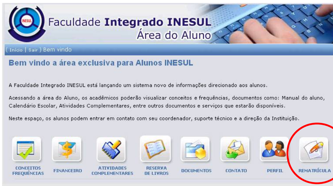
IMAGEM 03 - ÍCONE DE REMATRÍCULA

2º PASSO - APÓS O ALUNO REALIZAR O ACESSO ATRAVÉS DE SEU LOGIN E SENHA, SERÁ APRESENTADO UM ÍCONE “ REMATRÍCULA ” ONDE DEVERÁ SER CLICADO, CONFORME IMAGEM 03.